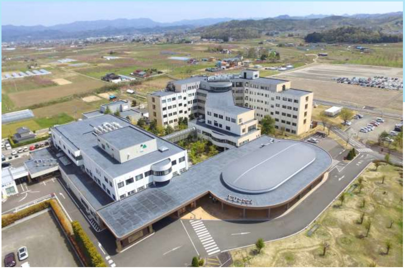
現在の北福島医療センター。写真の右上（南側）の空地が新施設の建設地