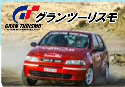
グランツーリスモ