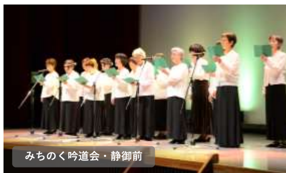
みちのく吟道会・静御前

10月13日（日）、恒例の伊達地区の芸能発表会が、ふるさと会館で開催されました。今回は午前・午後の4時間、26の団体・個人が、練習を重ねた成果をステージで披露しました。観客は出演者の熱演に拍手を送り「がんばれ」と声援を送っていました。主催の伊達町文化団体連絡協議会のみなさんは、準備から当日の進行まで、大忙しで活躍していました。