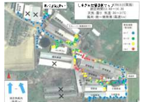
県北家畜保健衛生所が測定した臭気マップ

その他、協議会のモニタリングの状況、市の悪臭の測定結果などが報告されました。次回十一月の会議では、悪臭対策先進事例として、米沢市の視察を実施することなどが承認されました。