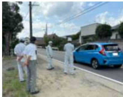
県・市の担当課長と役員で県道の現地確認

県へは県道保原桑折線の上ケ戸地内のカーブの改修を要望したところ、8月20日に県北建設事務所・伊達市の担当課長さんが訪れ、本会役員と現地の確認を行いました。県としてはカーブの危険性は十分認識したが、予算的に早期の全面改良は困難なので、当面は路面表示や防護柵など