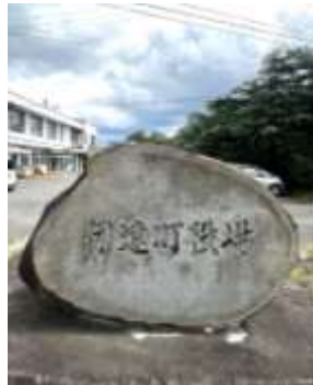
町役場の石碑は記念として残されます。