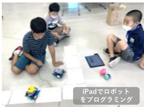
iPadでロボットをプログラミング

8月には「夏休み・ロボット教室を開催し、東小の子どもたちがロボットのプログラミングを体験しました。今後も楽しく学べるイベントを提供していきます。