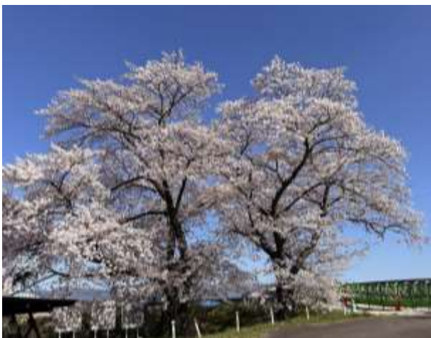
敷地東側の2本の桜が残されます。