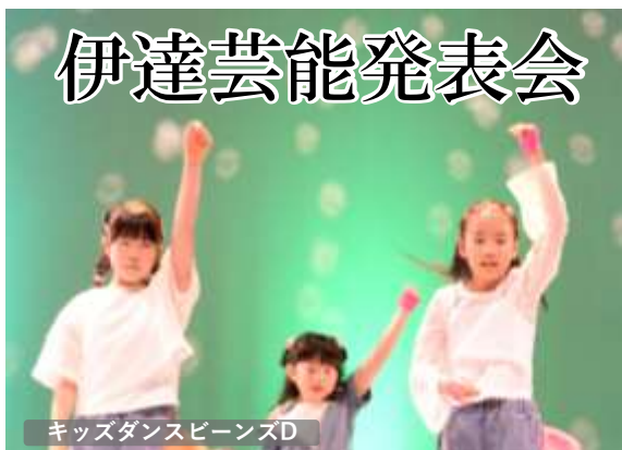
キッズダンスビーンズD

10月13日（日）、恒例の伊達地区の芸能発表会が、ふるさと会館で開催されました。今回は午前・午後の4時間、26の団体・個人が、練習を重ねた成果をステージで披露しました。観客は出演者の熱演に拍手を送り「がんばれ」と声援を送っていました。主催の伊達町文化団体連絡協議会のみなさんは、準備から当日の進行まで、大忙しで活躍していました。