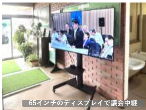
65インチのディスプレイで議会中継

また、正面玄関に大型ディスプレイを設置し、ケーブルテレビやYouTubeなどが視聴できるようになりました。お宅のケーブルテレビを