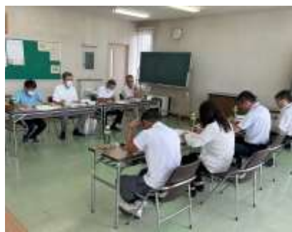
東交流館で伊達市から回答を受ける

市へは箱崎・伏黒地区の老朽排水路の整備を要望し、8月26日に回答がありました。住民による排水組合は伊達地区だけの制度で、町時代の条例を引き継いでいるので、取り扱いの変更は困難との回答でした。なお、今後、市も協力して地域で現状の確認を進めることとなりました。これらは地域の重要課題であり、連合会ではねばり強く要望を続けていく考えです。