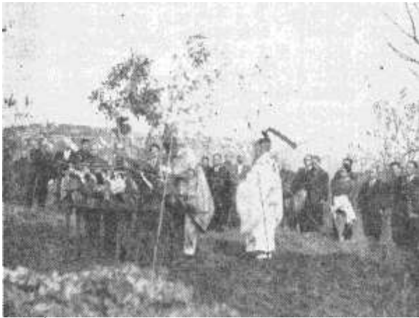
庁舎地鎮祭(昭和39年11月25日)。工事費は3,481万円。同じ年、伊達中学校の体育館も建設着工。