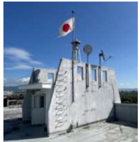
59年間、正午を告げた屋上のサイレン