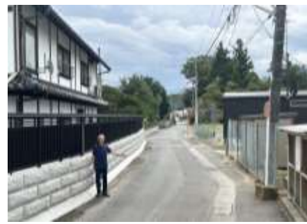
旧橋商店から愛宕山へ向かう箱崎の玄関道路