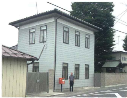
伏黒銀座の面影を残す旧伏黒郵便局前で。