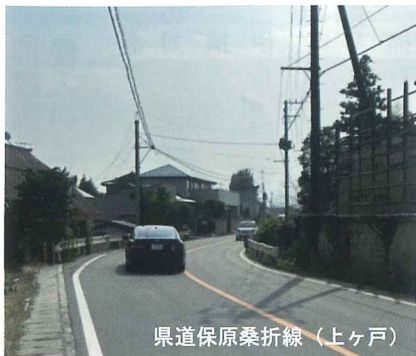
県道保原桑折線（上ヶ戸）