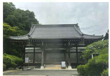
尊像は現在は福厳寺の本堂に安置

「先人の遺産を現代に修復することで、地域の絆が再確認できました。大切に引き継いでいきたいです」と語ります。