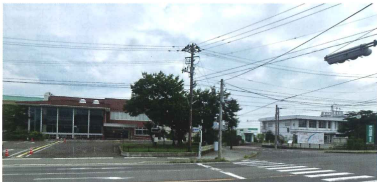
▲福祉センター（左）、現在の伊達総合支所（右）

伊達総合支所の業務が、9月17日から西側に隣接する福祉センターに移転します。同支所の改築工事のため、期間は新庁舎が完成する令和8年4月（予定）までです。