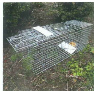
▲ 箱わな。免許が必要です。