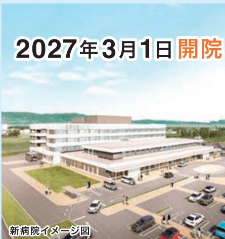
新病院イメージ図