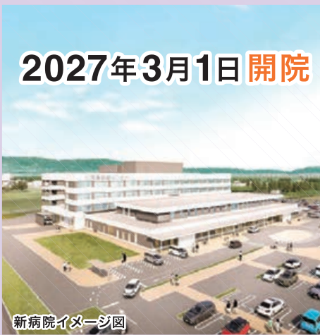
新病院イメージ図