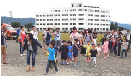
7月23日(土)職員南駐車場で仁泉会夏祭り