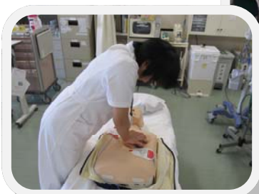
実際にAEDを使用した 一次救命処置法を 体験しました