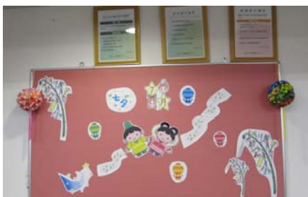
なごみ病棟のたなばた飾り