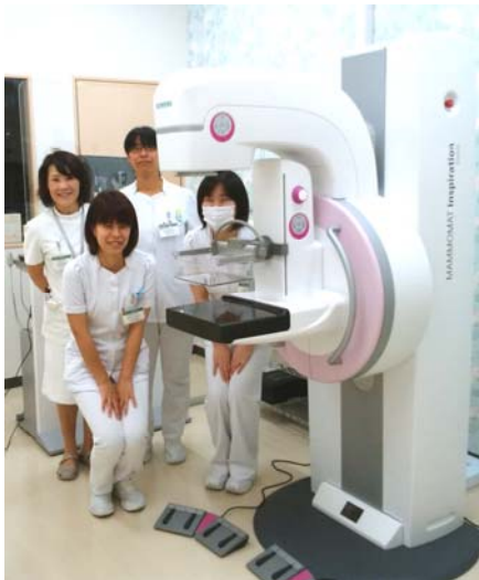
新しいマンモグラフィ装置。撮影はすべて女性が撮影します。

2017年8月より、乳腺疾患センターに最小限の被ばくで負担の少ない検査を実現したドイツ・シーメンス社の「MAMMOMAT Inspiration Prime Edition」を導入し、より高精度な検査体制を実現しました。