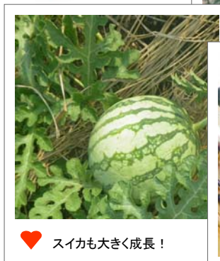
♥ スイカも大きく成長！