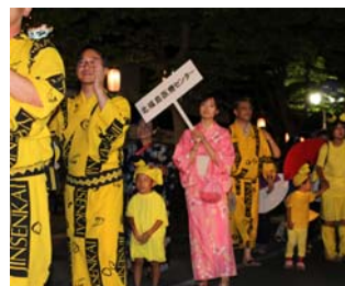
昨年の北福島医療センターチーム

平成29年8月11日（金）、保原町陣屋通り・保原中央交流館前で開催されるサマーフェスティバルに、北福島医療センターチームは今年も参加します。盆踊り大会や保原よいこ踊りで今年も熱く盛り上げます！我がチームを見かけたら声援をお願いします！！