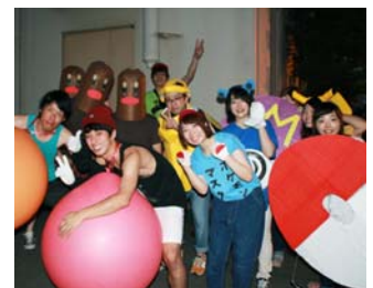
リハビリ科はポケモン軍団で参加